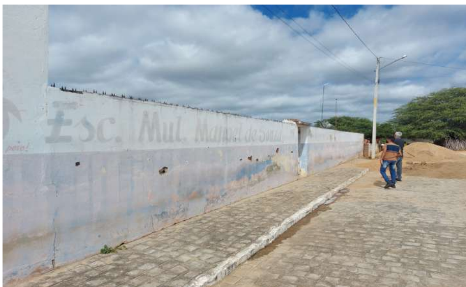
Escola Municipal Manoel de Souza - ausência de rampa na entrada da escola.

1 - Ausência de rampa de acesso à escola - escolas Manoel de Souza e José Ferreira da Silva;