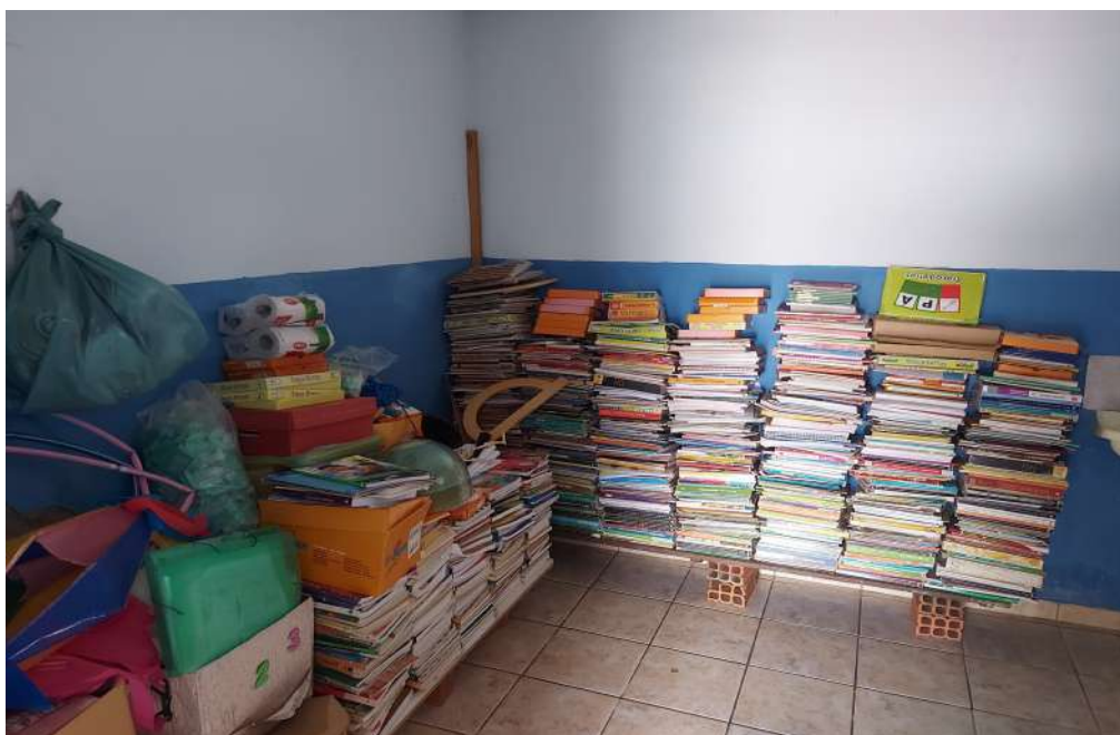
Escola Municipal Manoel de Souza - utilização da cozinha para outros fins.

Durante visita realizada na escola Manoel de Souza verificou-se a utilização da cozinha para outros fins.