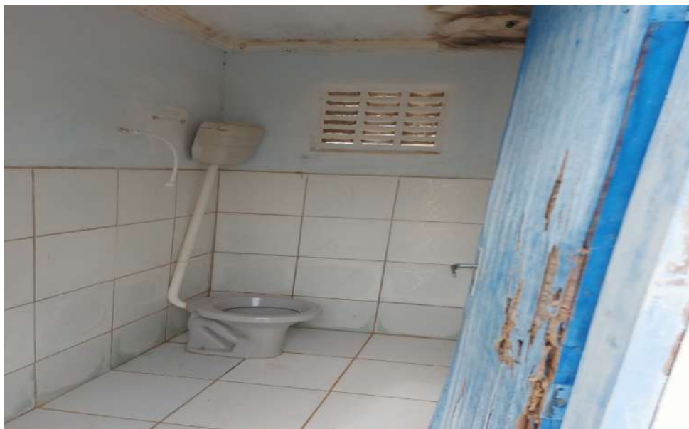
Escola Municipal José Ferreira da Silva - banheiro não adaptado para cadeirantes.