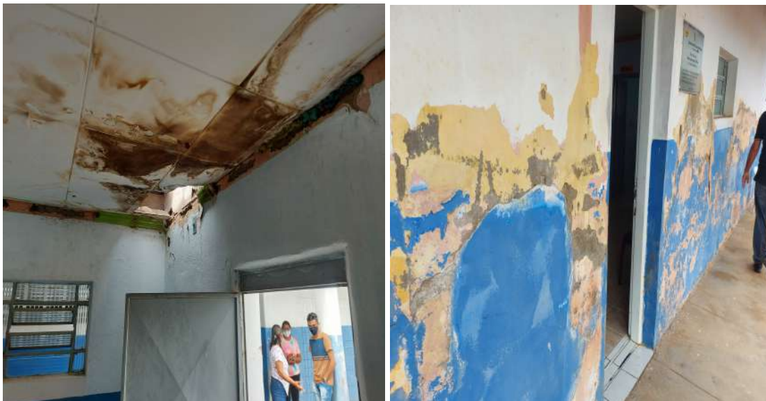
Figura 01- Detalhe de infiltrações nas paredes na Escola Manoel de Souza