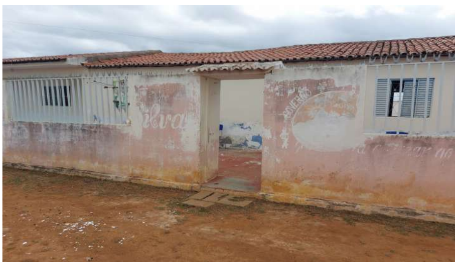
Escola Municipal José Ferreira da Silva - ausência de rampa na entrada da escola.