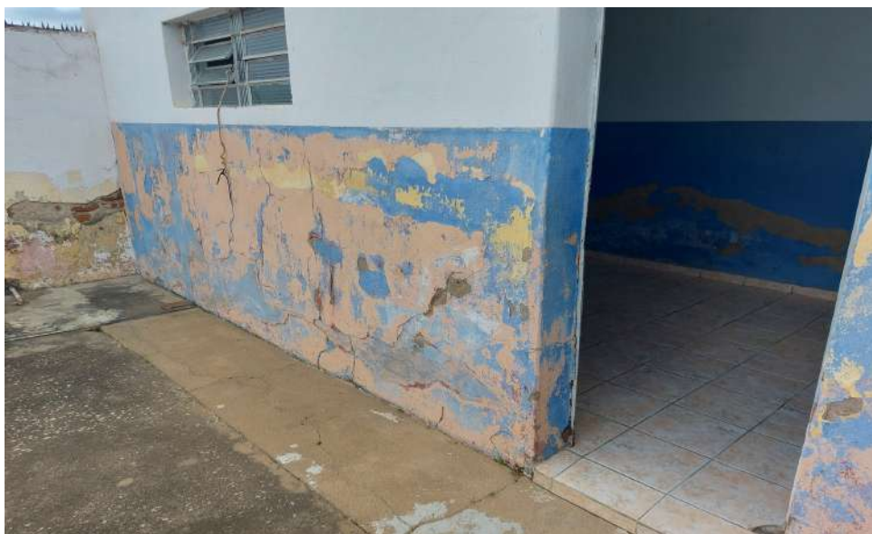
Escola Municipal Manoel de Souza - Salas de aula não acessíveis a cadeirantes.

3 - Salas de aula não acessíveis a cadeirantes - escolas Manoel de Souza e José Ferreira da Silva;