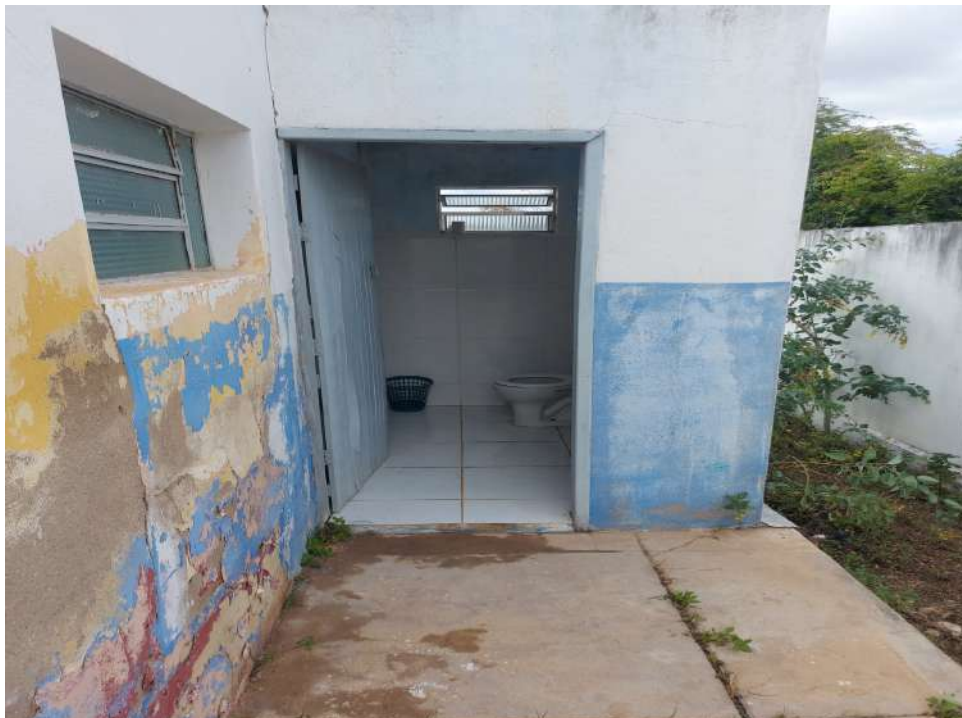
Escola Municipal Manoel de Souza - banheiro não adaptado para cadeirantes.

2 - Ausência de banheiros adaptados a cadeirantes - escolas Manoel de Souza e José Ferreira da Silva;