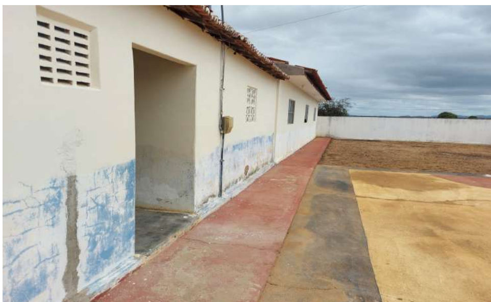
Escola Municipal José ferreira da Silva - Salas de aula não acessíveis a cadeirantes.

Face ao exposto, às situações encontradas estão em dissonância com a Lei Maior, que tem por princípio a dignidade da pessoa humana, encartado no art. 1º, inciso III da Constituição Federal.