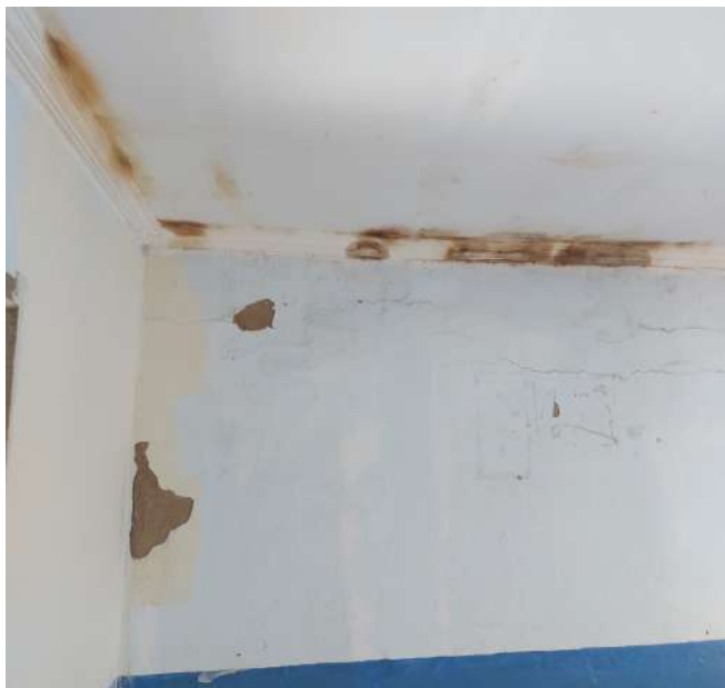
Figura 02- Detalhe de infiltrações nas paredes na Escola José Ferreira da Silva

Ressalte-se que a vistoria realizada por esta equipe não tem caráter técnico de avaliação estrutural ou de conformidade com as normas técnicas de instalações prediais. Os problemas relatados foram identificados a partir de uma observação apenas visual e são perceptíveis a qualquer cidadão. Pretende-se, aqui, apenas chamar a atenção dos gestores responsáveis para a necessidade de uma avaliação especializada da estrutura física das escolas, para que possa planejar as intervenções necessárias de manutenção ou reparos, com o objetivo de proporcionar um ambiente seguro e salubre para a comunidade escolar.